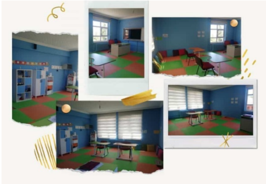
Özel Eğitim sınıfı