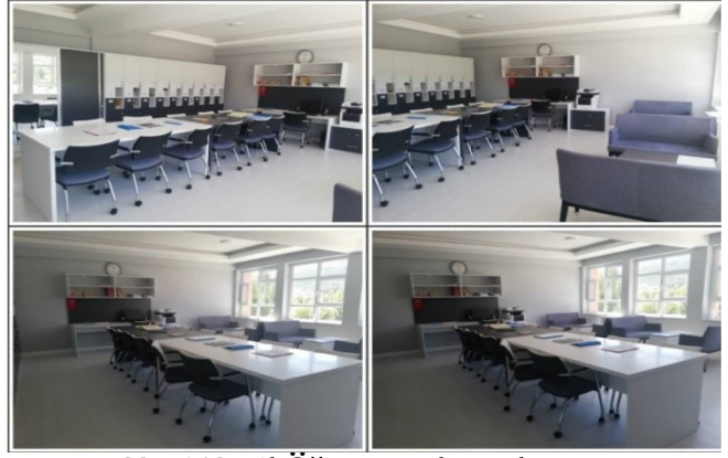
Yeni Nesil Öğretmenler Odası