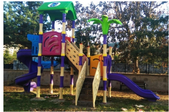
Ana Sınıfı - Çocuk Parkı